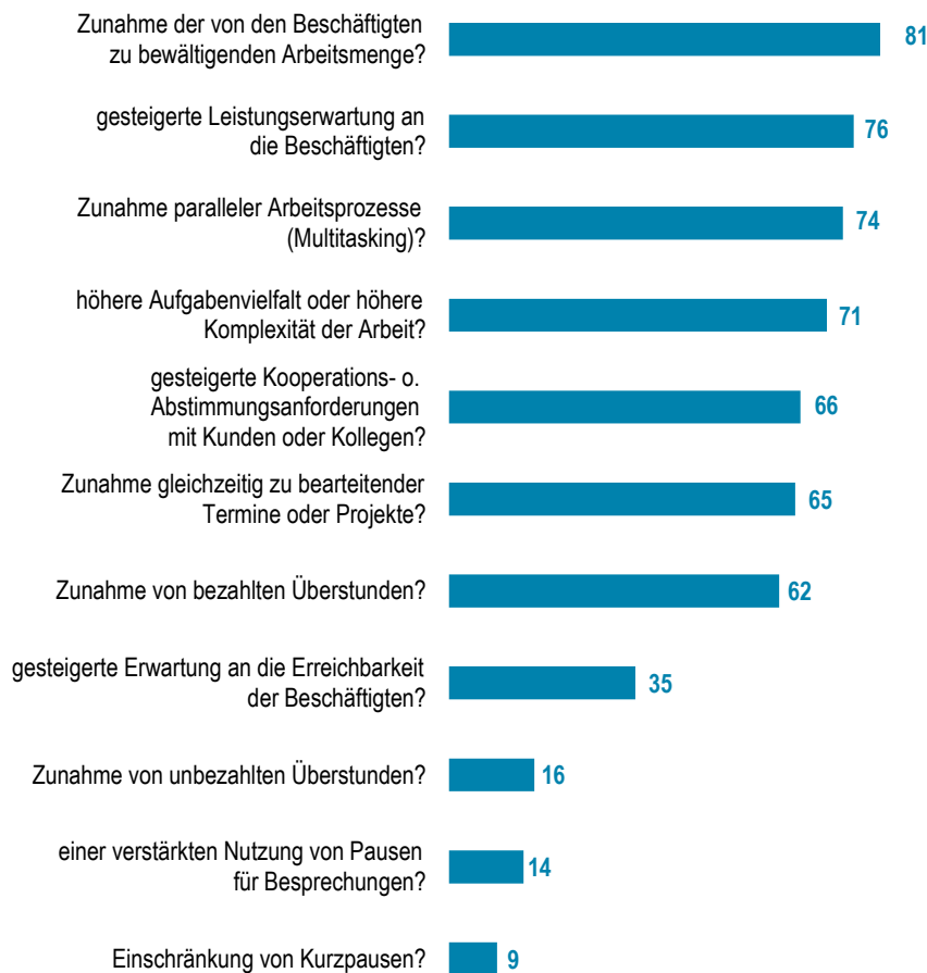
Abb. 2 Entwicklung der Arbeitsbedingungen in den Betrieben in den letzten zwei Jahren Angaben der Betriebsräte, in Prozent