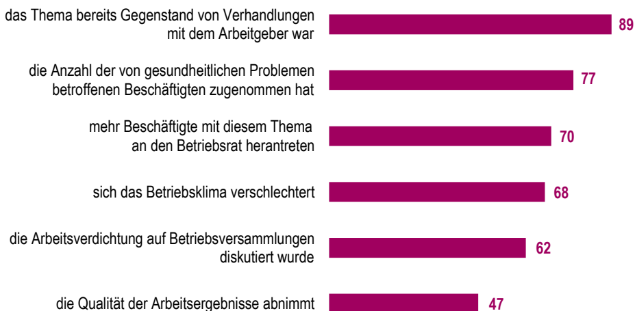
Abb. 1 Arbeitsverdichtung äußert sich darin, dass.... Angaben der Betriebsräte, in Prozent

Die Befunde der WSI-Betriebsrätebefragung 2018 zeigen, dass 80 % der Betriebsräte in den letzten zwei Jahren eine gestiegene Arbeitsintensität in den Belegschaften wahrnehmen – besonders im Dienstleistungsbereich (Erziehung, Gesundheit, aber auch Banken und Versicherungen). Die hohe Bedeutung in den Betrieben zeigt sich vor allem darin, dass die Arbeitsintensivierung in 89 % der betroffenen Betriebe bereits Gegenstand von Verhandlungen mit dem Arbeitgeber war und in 62 % auch auf Betriebsversammlungen diskutiert wurde. Die Arbeitsintensivierung bleibt für die Belegschaften offenbar nicht folgenlos: 77 % der Befragten sind der Auffassung, dass dadurch die Anzahl der gesundheitlichen Probleme zugenommen hat und in 68 % hat sich in Folge der Arbeitsverdichtung das Betriebsklima verschlechtert. Dass auch die Qualität der Arbeitsergebnisse darunter leide, vermuten 47 % der Betriebsräte.