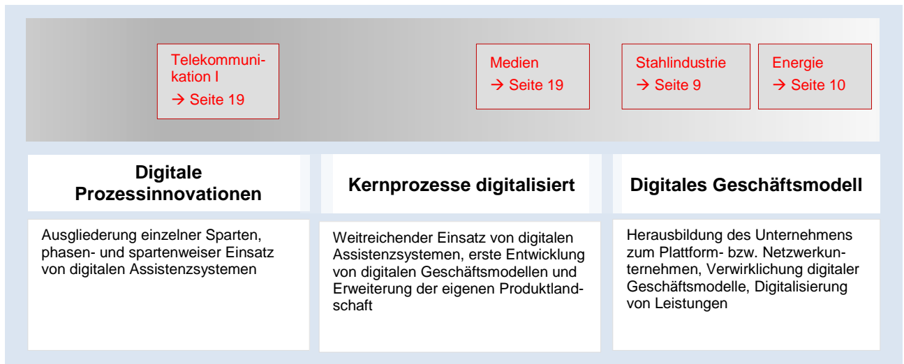
Abbildung 1: Geschäftsmodelle – Grad des Wandels