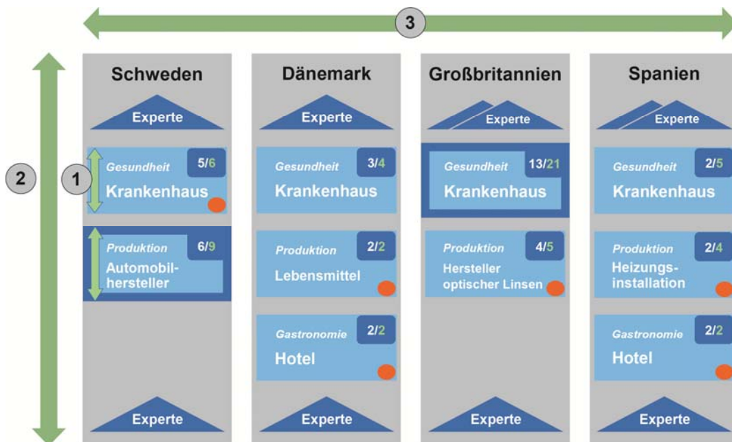
Abbildung 2.: Darstellung der Auswertungsstrategie

Die Ebene der betrieblichen Fallstudien dient vorrangig dazu, das konkrete Vorgehen (das Wie? ) beispielhaft und prozesshaft nachzuzeichnen und das Zusammenspiel von relevanten Rahmenbedingungen mit der betrieblichen Ebene zu erklären. Es ist jedoch nicht der Anspruch der Fallstudien, Aussagen über die Repräsentativität der beobachteten Phänomene im