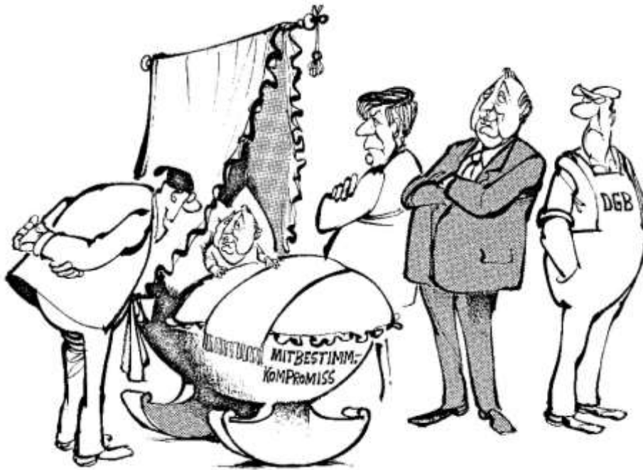
Abb. 1: Das Mitbestimmungsgesetz als ungeliebter Bastard (Dezember 1975). Veröffentlichung mit freundlicher Genehmigung von Horst Haitzinger

„Ach wie niedlich, wer ist denn der Papi?“