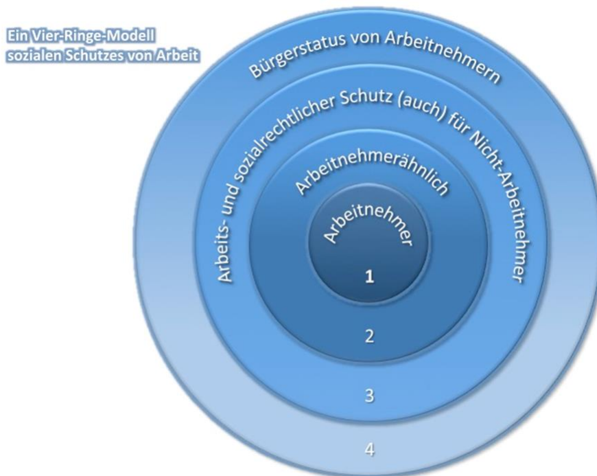
Abb. 2 Vier-Ringe-Modell des sozialen Schutzes von Arbeit (Eigene Darstellung)

Ich verbinde mit diesem Modell die Anregung an die Kommission „Arbeit der Zukunft“, auf die in Zukunft sich wohl noch vertiefende Krise des Arbeitnehmerbegriffs gestalterisch in doppelter Weise zu reagieren: