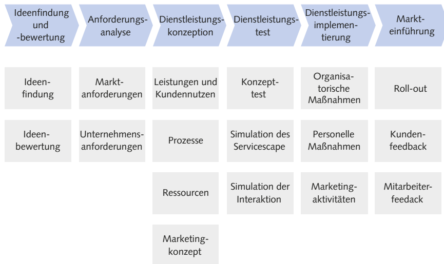
Abb. 2: Beispiel eines Dienstleistungsentwicklungsprozesses