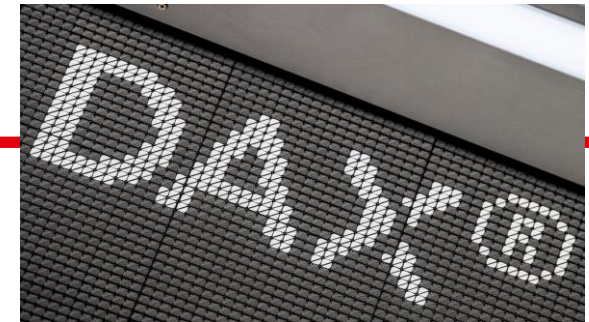
Tabelle 2: Branchenzugehörigkeit der 40 DAX-Konzerne