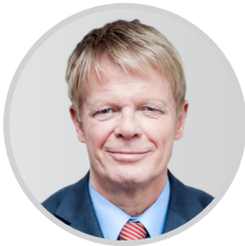
Reiner Hoffmann, Vorsitzender des Deutschen Gewerkschaftsbundes und Vorsitzender des Vorstands der Hans-Böckler-Stiftung Jahrgang 1955

Gelernter Groß- und Außenhandelskaufmann und Diplom-Ökonom