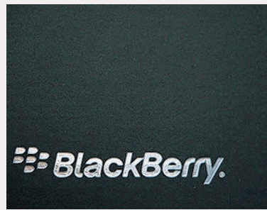
AGU Kein Empfang.

Umstellung habe nicht wie vorgesehen funktioniert, so dass sich ein enormer Datenstau gebildet habe, so RIM. Erst am vierten Tag begann sich die Lage zu normalisieren – doch der Stau löste sich nur langsam auf. Damit erleidet der Hersteller der vor allem bei Geschäftskunden und Politikern beliebten Smartphones erneut einen Rückschlag. Wegen der harten Konkurrenz etwa durch Apples iPhone senkte der BlackBerry-Hersteller bereits mehrfach die Gewinnprognose. Die Kanadier streichen derzeit etwa jede zehnte Stelle.