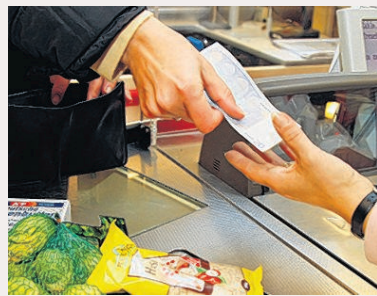
AGU Arbeitgeber zur Kasse.

sen sich an den Mindestlohn halten. Je nach Bundesland wird der unterschiedlich hoch ausfallen. Das bedeutet: Die Beschäftigten in Baden-Württemberg können mit einem höheren Basislohn rechnen als Mitarbeiter im Norden Deutschlands. Die Arbeitgeber wollen mit diesem Schritt der Politik zuvorkommen. SPD und Linke setzen sich schon seit Jahren für einen gesetzlichen Mindestlohn ein. Die Dienstleistungsgewerkschaft Verdi im Bezirk Stuttgart dagegen fordert, dass der Basislohn mindestens 9,50 Euro betragen müsste.