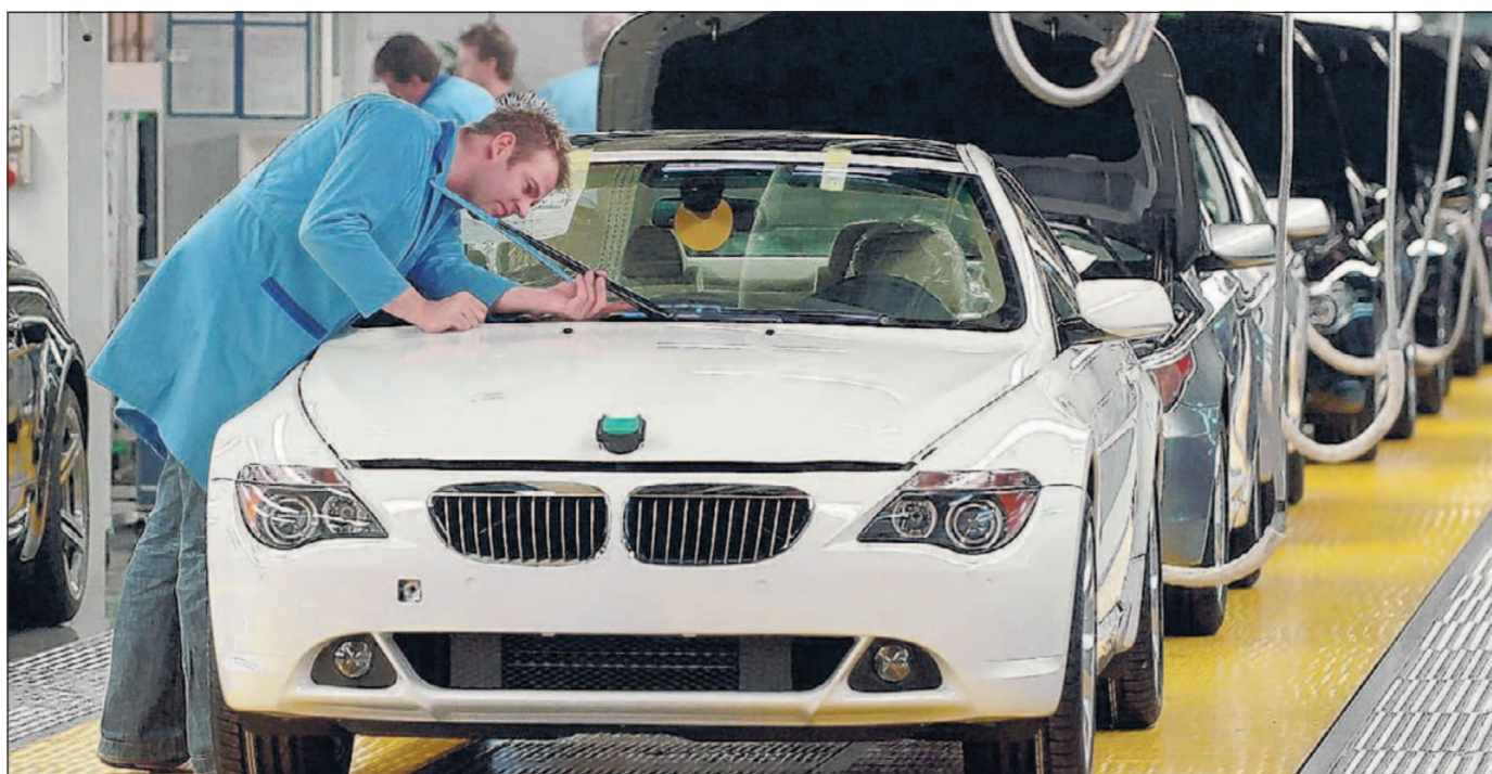
Endkontrolle der 6er-Reihe im Werk Dingolfing. Stellenabbau gibt es beim Autobauer BMW keinen.

Telefon (0 89) 53 06-454 Telefax (0 89) 53 06 86 60 email: wirtschaft@merkur-online.de